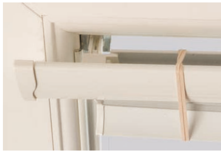
14. En laissant les élastiques en place, aligner la fente d'extrémité du caisson avec le support.