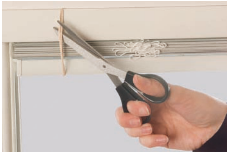
16. Couper élastiques et abaisser soigneusement les lattes sur le cadre en bas.