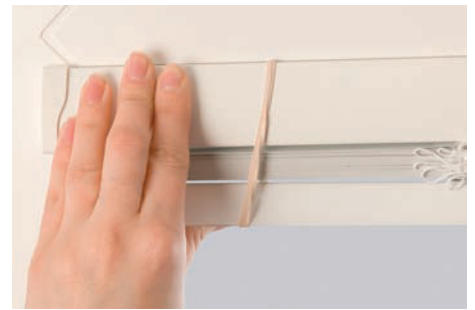
15. Veiller à ce que le caisson soit correctement aligné et effectuez une pression forte.