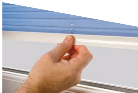
18. Pour aligner le rail du bas horizontalement, il suffit de tirer dans la position désirée. Il restera en position sous tension. Vérifier le fonctionnement correct du store.