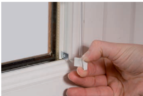
17. Fixer la pièce de maintien du cordon sur l'attache métallique inférieure.

Les étapes nécessaires pour la pose des stores INTU® Plissés ou Duette sont les mêmes que pour INTU® vénitiens jusqu'à l'étape 16. A partir de l'étape 17, suivez les instructions ci-dessous