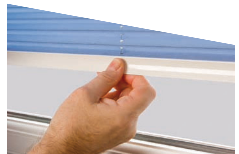
*19. Si le store ne tient pas en position intermédiaire, réduire les longueurs de cordon sur la pièce de maintien (17) en faisant un noeud un peu plus haut, équilibrer toujours les longueurs de cordons de chaque côté.