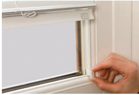
17. Fixer la pièce de maintien du cordon sur l'attache métallique inférieure. Répétez l'opération au côté opposé.