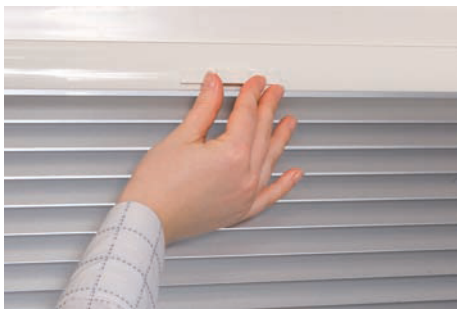
19. Vérifier le fonctionnement correct du store, monter / descendre et ouvrir / fermer