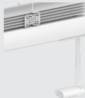
Option pose vissée