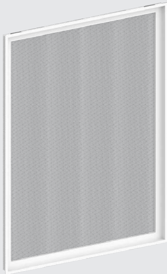
MFiX11 ALU Moustiquaire fixe