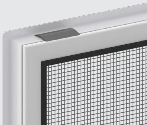
Fixation par clipsage du profil pour pose dans le châssis