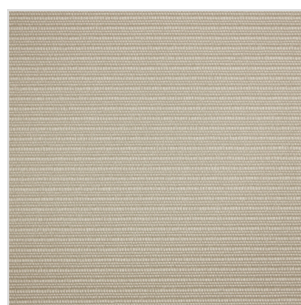
NAB3202 / NAR3202