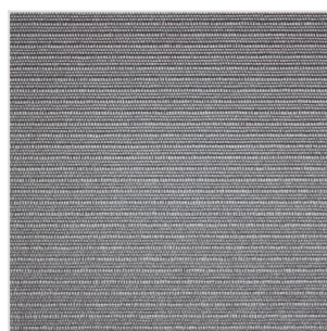
NAB3200 / NAR3200