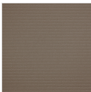
NAB3206 / NAR3206