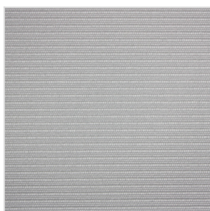
NAB3201 / NAR3201